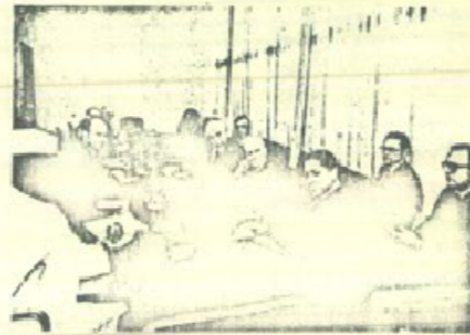
La delegación del Congreso Mundial de las Fuerzas de Paz con el Presidente del Consejo de Seguridad, Sr. Peter Jankowitch (de espaldas).

Las visitas realizadas a estas tres personalidades de la ONU han sido ampliamente difundidas por los medios de comunicación de masas, suscitando un vivo interés entre las delegaciones presentes en la Asamblea General. La delegación