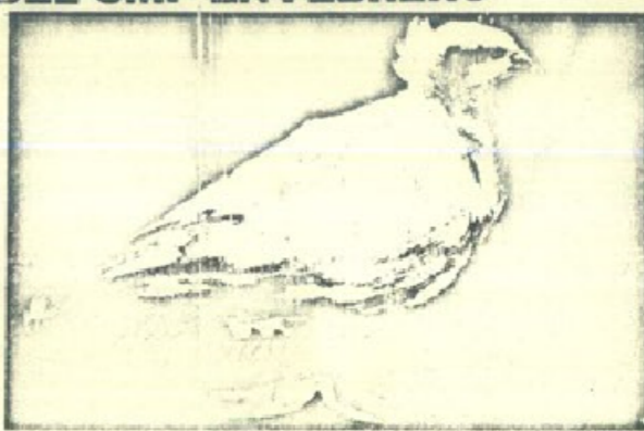
La paloma de la paz, de Picasso, símbolo del Movimiento mundial de la paz cuyo XXV aniversario será celebrado en 1974.

la luz del progreso realizado en la arena internacional y en el seno del movimiento de la paz.