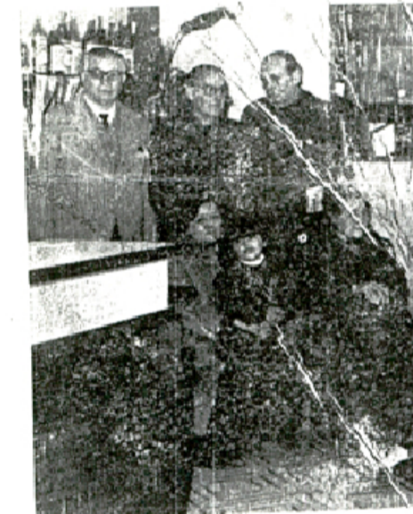
Familiares de presos políticos en el hall de un hotel de nuestra ciudad. En gran cantidad arribaron ayer a nuestra ciudad para informarse acerca del destino que se daría a los cuerpos de los guerrilleros muertos. Al promediar la

BUENOS AIRES, 23 (AP) — La Junta de Comandantes en Jefe se reunirá nuevamente mañana para considerar cuestiones de actualidad nacional. Las deliberaciones, que comenzarán a las 8 horas, serán presididas por el jefe del Estado Alejandro A. Lanusse y asistirán todos sus integrantes. Durante que en la oportunidad será tema de análisis los últimos episodios acaecidos en la ciudad de Trelew.